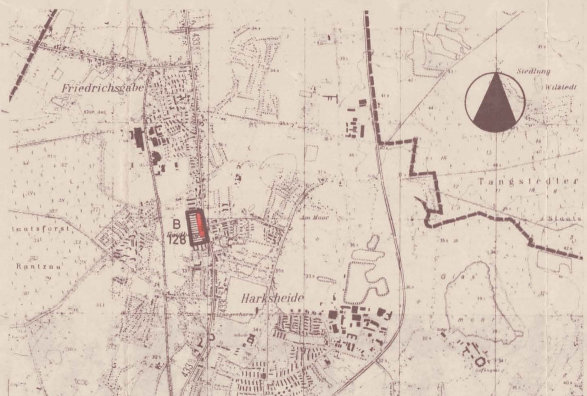
LAGEPLAN M. 1 : 25000

DIE UNTERTEILUNGEN DER OFFENTLICHEN VERKEHRSFLÄCHEN (STRASSENQUERSCHNITTE) SIND NICHT GEGENSTAND DER FESTSETZUNGEN DES BEBAUUNGSPLANES.